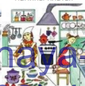
Дочка помогает маме готовить