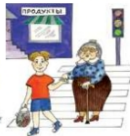
Переводить старушку через дорогу

diplomnaya-rabota.ru +7 (499) 403-1034 7429012@mail.ru