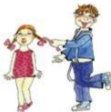
Дергать за косички