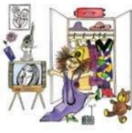
Дочка меряет мамины платья