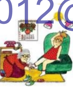
Бабушка разувает внучку