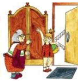
Девочка идет гулять