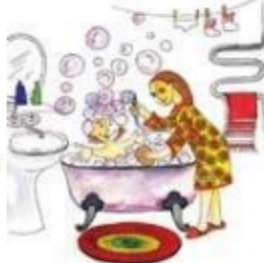
Мама моет дочку