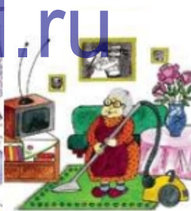
Бабушка убирается в квартире