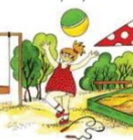
Девочка играет с мячом