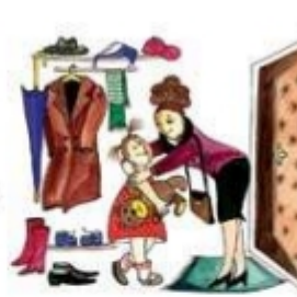
Мама одевается и прощается с дочкой