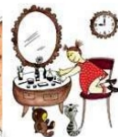
Дочка красится маминной косметикой