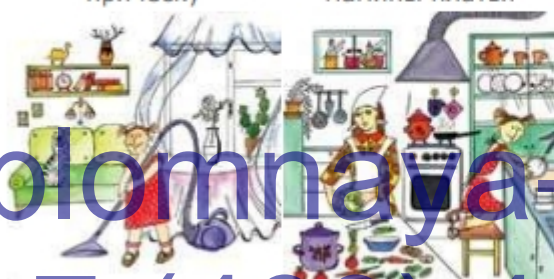
Дочка помогает пылесосить квартиру