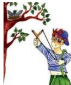
Стрелять из рогатки