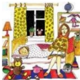
Мама читает дочке книгу на ночь