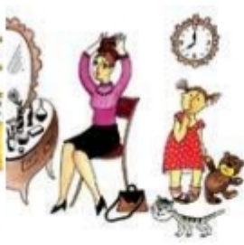
Мама собирается на работу