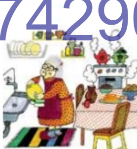
Бабушка готовит обед