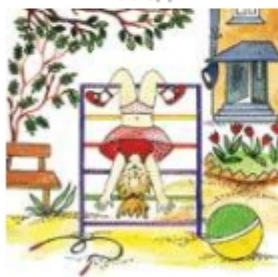
Девочка играет во дворе