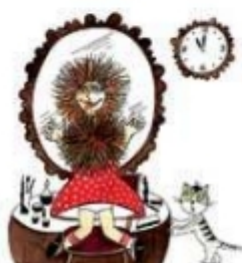
Дочка делает прическу