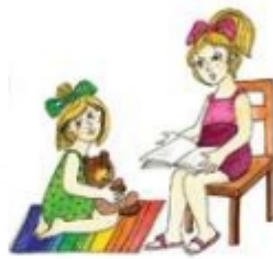
Читать книжку маленькой девочке