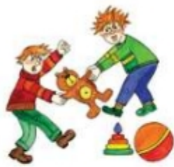
Отнимать игрушку у других детей