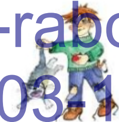
Дергать кота за хвост