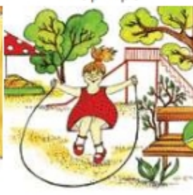
Девочка прыгает через скакалку